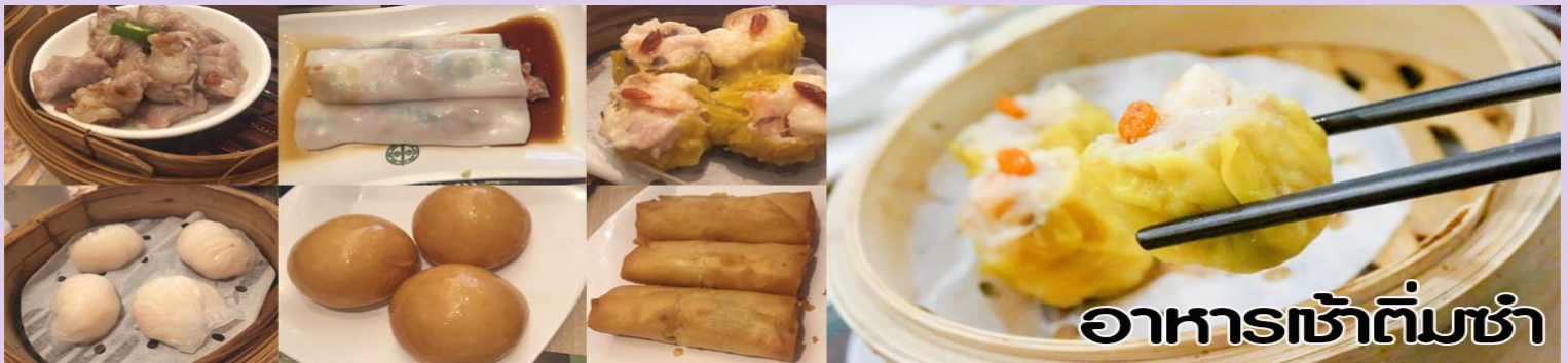
อาหารเช้าติ่มซ่า

นำทุกท่าน ไหว้ศาลเจ้าแม่ทับทิม ทินหัว (Tin Hau Temple) เป็นวัดเก่าแก่และสำคัญอีกวัดหนึ่งของฮ่องกง เพราะในสมัยก่อน ฮ่องกงเป็นเพียงหมู่บ้านชาวประมง ซึ่งเคารพนักถือเจ้าแม่ทับทิมว่าเป็นเทพีแห่งท้องทะเล เพื่อให้เดินทางปลอดภัย เวลาออกไปทำงานไกลๆ หรือออกหาปลา นอกจากการมาสักการะบูชาเจ้าแม่ทับทิมในเรื่องของการเดินทางให้ปลอดภัยแล้ว ไฮไลท์สำคัญอีกอย่างหนึ่งของวัดเจ้าแม่ทับทิม ทินหัว (Tin Hau Temple) จะเป็นขดรูปสี่แดงขนาดใหญ่ ที่แขวนอยู่ตามเพดานด้านบนในของวัดก็จะเป็นสถาปัตยกรรมแบบวัดจีน สร้างขึ้นตั้งแต่ปี ค.ศ. 1876 โดยทางเข้าของวัดจะอยู่ติดกับสวนสาธารณะเล็ก ๆ ที่มีต้นไม้ใหญ่หลายต้น ให้บรรยากาศร่มรื่น