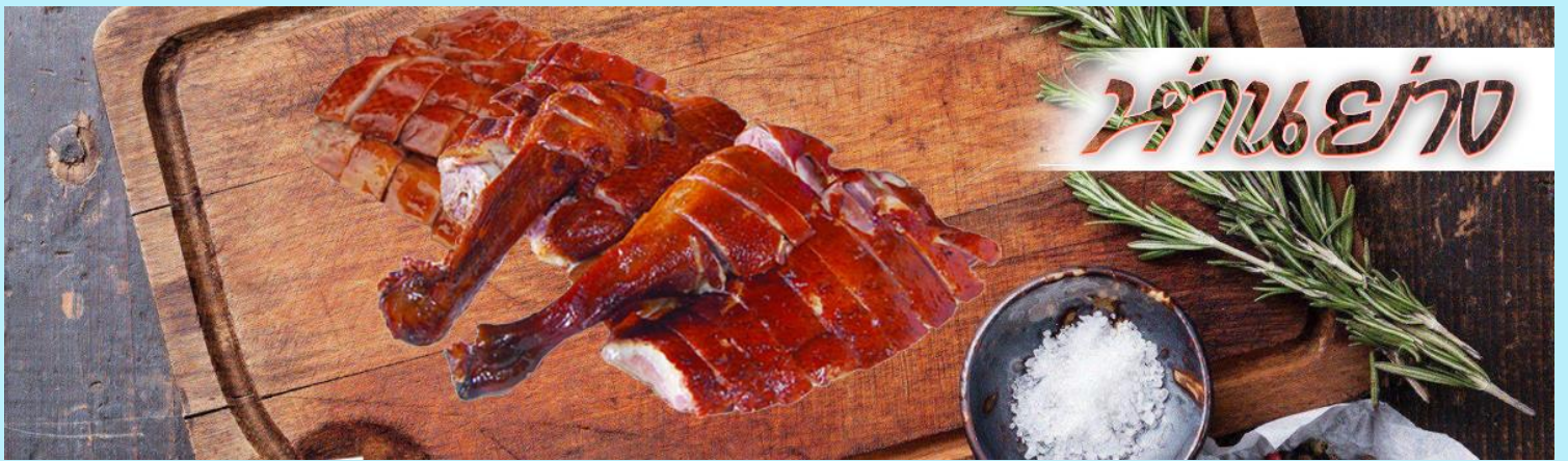
ร้านอาหาร

เที่ยง รับประทานอาหารกลางวัน ณ กัณฑ์ดาตาร ***เมนูท่านอย่างฮ่องกงแสนอร่อย***