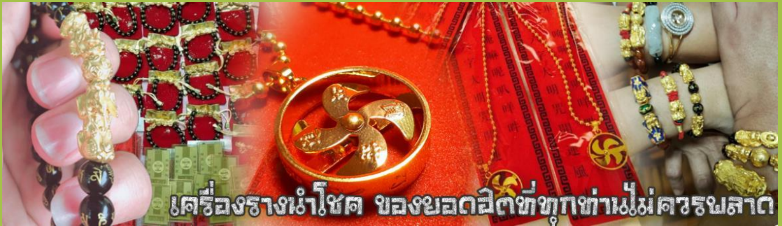
เครื่องรางนำโชค ของยอดเยี่ยมที่ทุกท่านไม่ควรพลาด

จากนั้นนำท่านสู่ ร้านหยก ชมความงามปีเซียะ ที่เชื่อกันว่าเป็นวัตถุมงคลยอดเยี่ยม ที่มีการนำมาบูชา เพื่อให้ช่วยป้องกันสิ่งชั่วร้าย เรียกทรัพย์สินเงินทองให้ไหลมาเทมา และกักเก็บทรัพย์นั้นไม่ให้รั่วไหลออกไปไหนได้ ชาวจีนโบราณเชื่อกันว่า ปีเซียะเป็นสัตว์ประหลาดที่รวมลักษณะของสัตว์มงคลทั้ง 5 ชนิดไว้ด้วยกัน ได้แก่ มังกร พญาราชสีห์หรือสิงโต, อินทรี, กวาง, และแมว โดยตามตำนานเล่าว่า ปีเซียะเป็นลูกมังกรตัวที่ 9 (เทพแห่งโชคลาภ) ของพญามังกรสวรรค์ มีชื่อเรียกด้วยกันหลายชื่อไม่ว่าจะเป็น “เทียนลก (กวางสวรรค์)” เป็นชื่อเดิม ส่วนจีนกวางตุ้งจะเรียกว่า “เผ่ฮ่า” และคนจีนแต้จิ๋วจะเรียกว่า “ผิซิว” และยังมีจำหน่ายยาสมุนไพรบำรุงเพิ่มความแข็งแรงตามความเชื่อของคนฮ่องกง