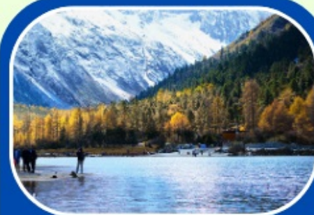
ป่ผิงโกว