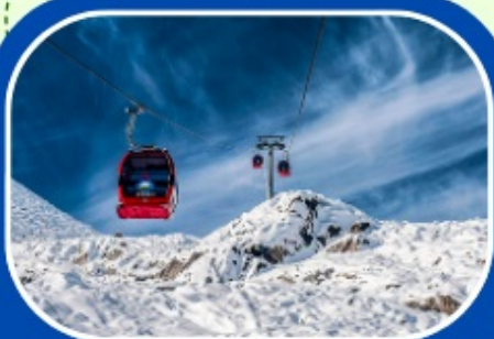
ต่าภูปิงชวน