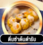
ต้มซ่าดับคำรับ