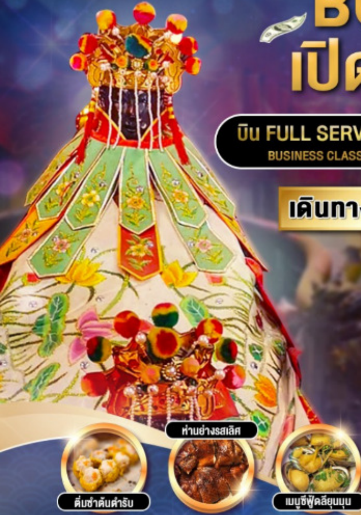
ทำอย่างรสเลิศ