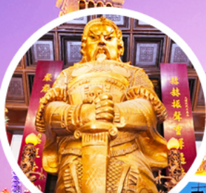
วัดแซงทอมัส