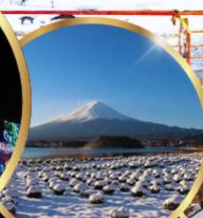
สวนโออิชิ พาร์ค