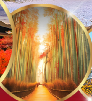
ป่าไฟ อาราชิยาม่า