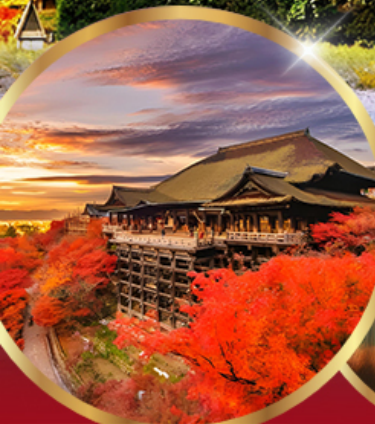
วัดคิโยมิจิ