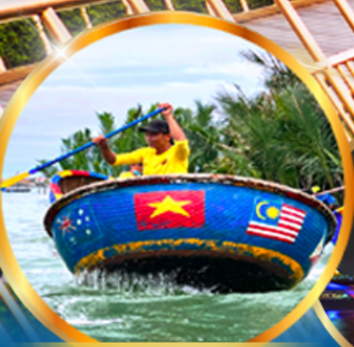
ล่องเรือกระดง