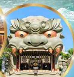
ศาลเจ้านิมะ ยาชากะ