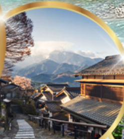
มาโกเมะจูกุ