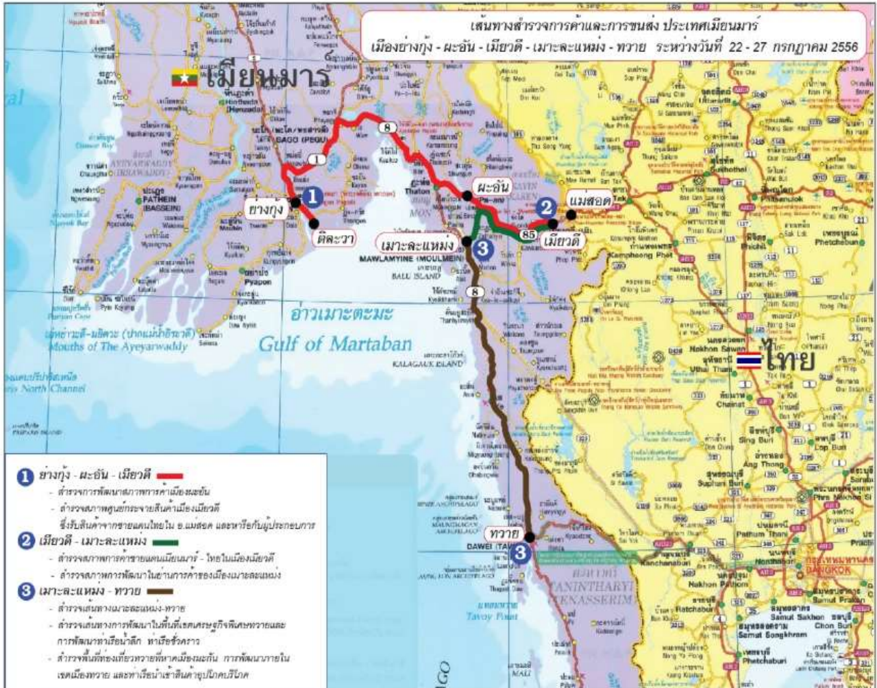
เส้นทางย่างกุ้ง - พะอั้น - เมียวดี - เมาะละเหม้ง - ทวาย