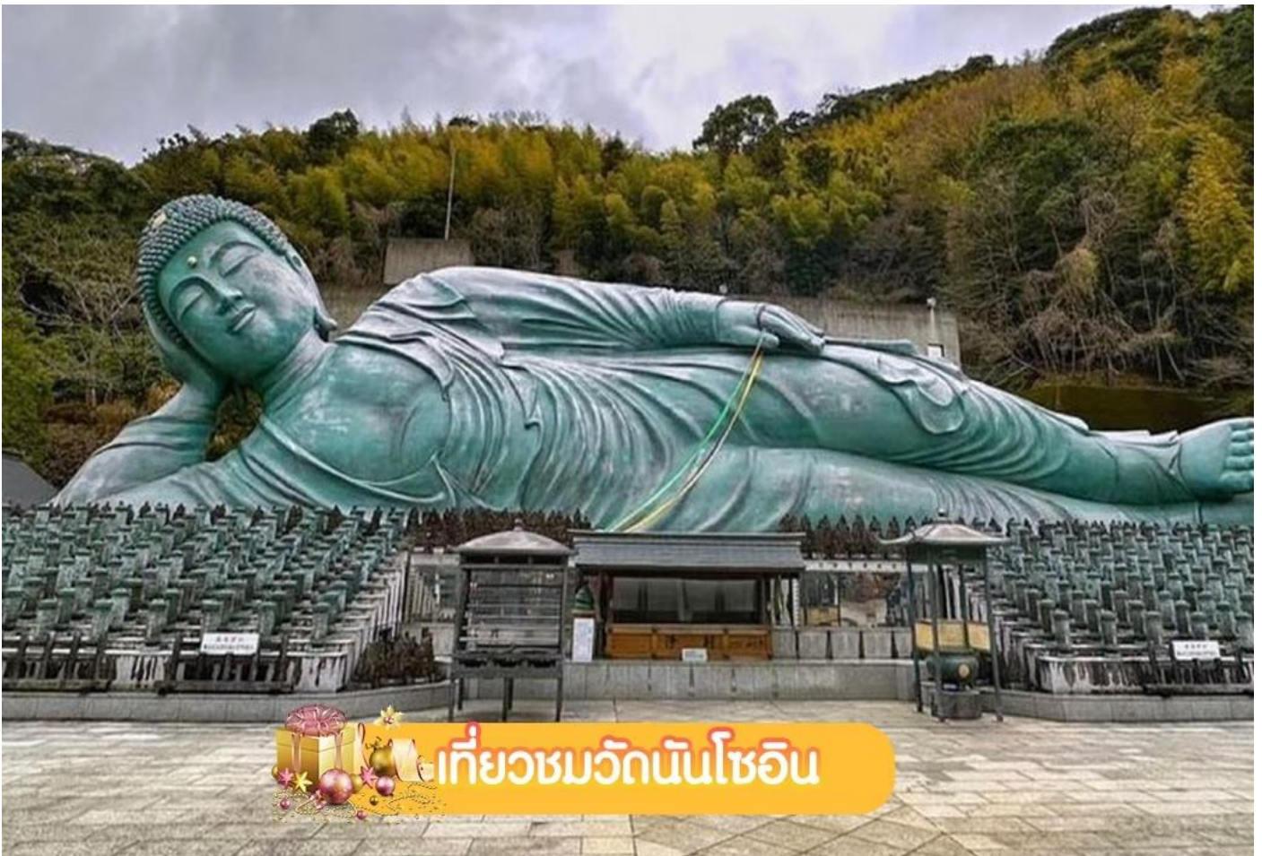
เที่ยวชมวัดนันโซอิน

... จนได้เวลาอันควร เดินทางต่อไปยัง วัดนันโซอิน (Nanzoin Temple) หรือที่เรียกว่า “วัดพระนอน” (รวมค่าเข้าชม) เป็นวัดพุทธที่ตั้งอยู่ในเมืองซาซากุริ เป็น พระพุทธรูปนอนทองสำริดที่ใหญ่ที่สุดในโลก โดยมีขนาดความยาว 41 เมตร สูง 11 เมตร หนัก 300 ตัน แกะสลักจากทองสัมฤทธิ์ขึ้นเดียวแล้วหล่อโดยใช้แบบหล่อไล่ซี่ผึ้ง โดยหลายคนเชื่อว่ารูปปั้นนี้สร้างขึ้นเพื่อปกป้องชาวฟูกูโอกะจากภัยธรรมชาติ บรรยากาศที่เจียบสงบ ขึ้นชื่อ เรื่องการขอพรโชคกลาง ควรเตรียมเหรียญ 5 เยน ในการทำบุญโยนเหรียญ **หมายเหตุ เป็นวัดที่เคร่งครัดในเรื่องการแต่งกาย ห้ามใส่กางเกง/กระโปรงสั้น เสื้อผ้าที่เปิดเผยร่างกาย ห้ามส่งเสียงดัง และใช้ไม้เซลฟี ... จากนั้นเดินทางเข้าสู่ ฟูกูโอกะ