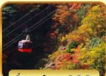
นั่งกระเช้าภูเขาโทโชไซ