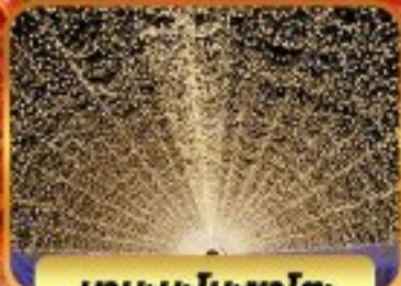
บาระนะโนะซาโตะ

โอบาร์(ซากุระ) เมืองเกียวโต วัดคิโยมิสึ(วัดน้ำใส) หมู่บ้านชิราคาวาโกะ ถนนชั้นมาชิซุจิ สะพานนาคาบิชิ ซ้อปบิง ชินโซบาชิ ย่านซาคาเอะ อีออน