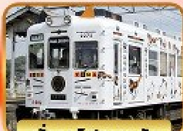
นั่งรถไฟทามาะริง