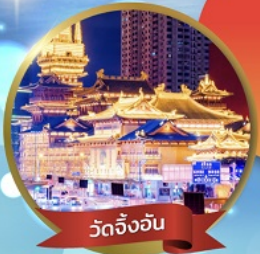
วัดจิ้งจัน