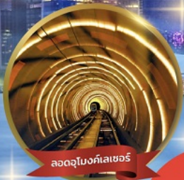
ลอดอุโมงค์เลเซอร์