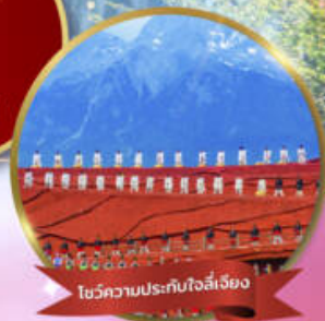
โชว์ความประทับใจลี่เจียง