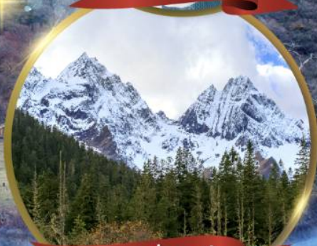
ภูเขาสี่ฤดู