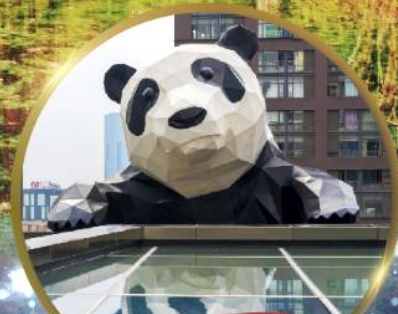
แพนด้ายักษ์

มหัศจรรย์ความงาม อุทยานจิวจ้ายโก (รวมรถเหมาเที่ยวอุทยานเต็มวัน) ชมอุทยานหวงหลง (รวมกระเช้า) • สี่ฤดู • อุทยานชวงเจียวโก (รวมรถอุทยาน) เมืองเก่าชงพาน • ถนนคนเดินจินหลี่ + ไถ่กูหลี่ • ชมแพนด้ายักษ์ป็นตึก