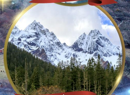
ภูเขาสี้ดรุณี