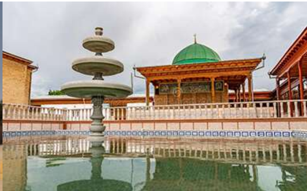
กลุ่มอาคาร khazrati shoh