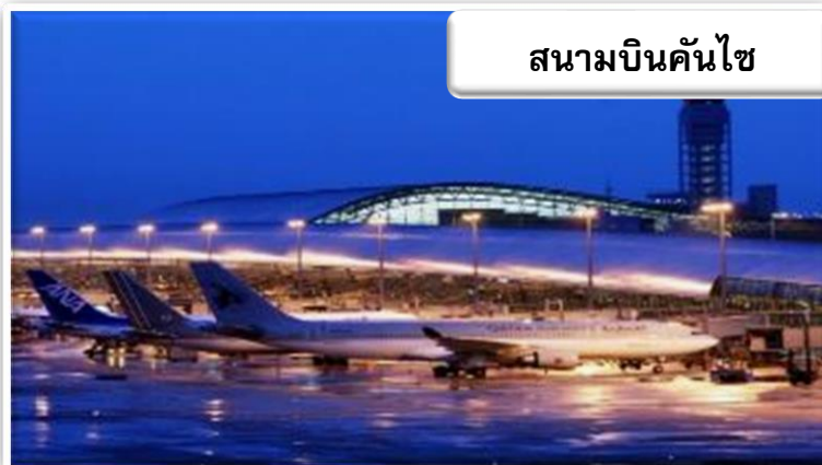
สนามบินคันไซ

เวลา 00.25 น. ออกเดินทางสู่ สนามบินคันไซ ประเทศญี่ปุ่น โดยสายการบินเจแปนแอร์ไลน์ เที่ยวบินที่ JL 728