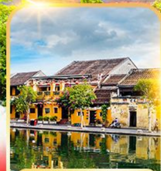
เมืองมรดกโลกฮอยอัน

ดานัง ฮอยอัน บานาฮิลล์ เที่ยวบานาฮิลล์เต็มวัน รวมบัตรเครื่องเล่น