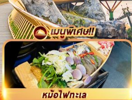
หม้อไฟทะเล