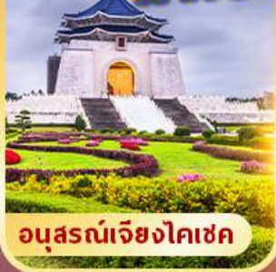
อนุสรณ์เจียงไคเชค