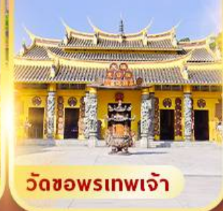
วัดซอพรเทพเจ้า