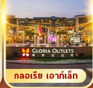
กลอเรีย เอาท์เล็ต