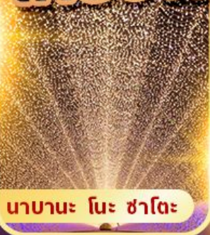
นาบาระ โนะ ซาโตะ