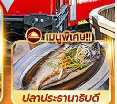
เมนูพิเศษ!! ปลาประรานาธิบดี