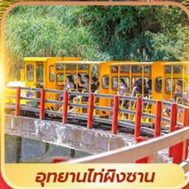
อุทยานไท่ผิงซาน