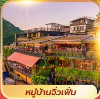
หมู่บ้านจิวเฟิน