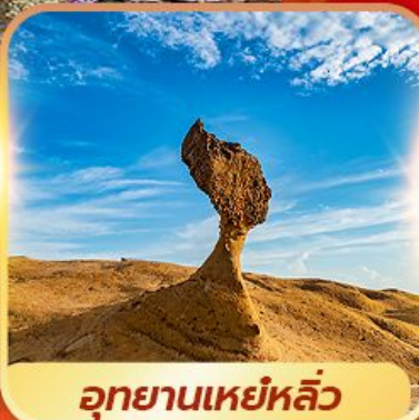
อุทยานเหยหลิว