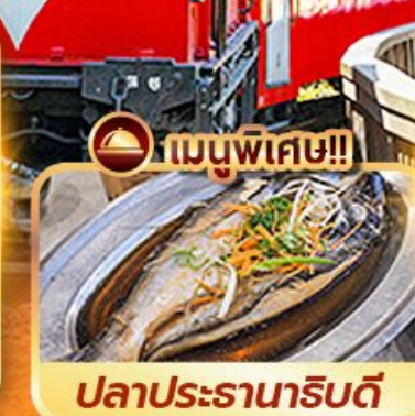
เมนูพิเศษ!!