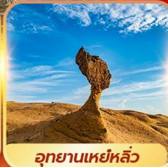
อุทยานเหยหลิว