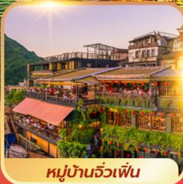
หมู่บ้านจิวเฟิน

ไต้หวัน เที่ยว 3 อุทยาน อาหลี่ซาน เหยหลิว ไท่ผิงซาน