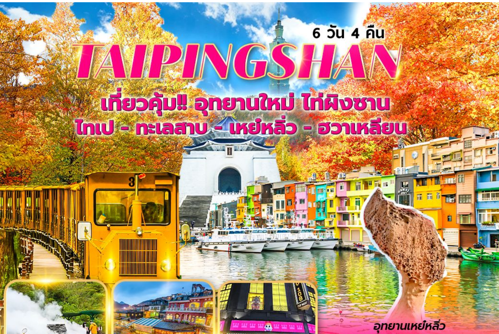
อุทยานเหย์หลิว

เที่ยวคุ้ม!! อุทยานใหม่ ไท่ผิงซาน ไทเป - ทะเลสาบ - เหย์หลิว - ฮวาเหลียน