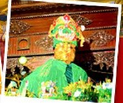
ขอพรแม่ยักยี