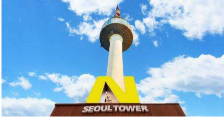
ค่าคืนได้แบบ 360 องศา

โซลทาวเวอร์ หรือ นัมซาน ทาวเวอร์ (N Seoul Tower) คือแลนด์มาร์คชื่อดังและสถานที่ท่องเที่ยวในเกาหลีใต้ที่ห้ามพลาดตั้งอยู่บนภูเขานัมซาน ภายในสวนสาธารณะนัมซานเป็นฐานส่งสัญญาณวิทยุและวิทยุโทรทัศน์แห่งแรกของกรุงโซล ซึ่งยังคงใช้งานอยู่ในปัจจุบัน และยังเป็นสถานที่ท่องเที่ยวในเกาหลีใต้ยอดฮิต สำหรับชมวิวกองโซลที่สวยงามในยาม