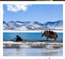
ทะเลสาบนำมู่ซั่ว