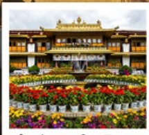
ตำหนักนอร์บูหลินมา

ชมวิวยอดเขานานเจียปาหว่า / จุดชมวิวกะเลปาหลูกลาง / อุทยานเขาเป็นยี / ระเบียบกระจก / วัดลามะ พระราชวังโปตาลา / วัดโจคัง / ถนนเปดหลียม / ทะเลสาบนำมู่ซั่ว / ตำหนักนอร์บูหลินมา / เมืองโบราณลั่วใต้