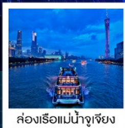
ล่องเรือแม่น้ำจูเจียง

ล่องเรือแม่น้ำจูเจียง / ช้อปปิ้งถนนปักกิ่ง / ช้อปปิ้งถนนซิงเซี่ยจิว / วัดไทรหัดตัน / ศาลเจ้าตระกูลเฉิน / ถนนคนเดินหย่งซิงฟาง