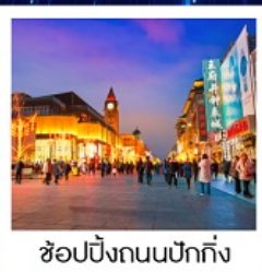
ช้อปปิ้งถนนปักกิ่ง