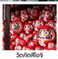
วัดกัตสึโองจิ