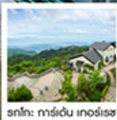
รถโก: การ์เด็น เกอร์เรซ