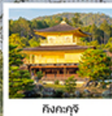
กิงคะกุจิ