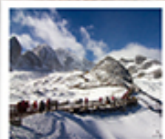
ภูเขาหินมังกรหยก

ลัดขีตมอวค / ไร่ตมอวค / เมืองโบราณเซงคี่ล่า / วัดลามซงจันหลิง / ช่องแคบเส็งกรรไค เมืองโบราณรุ่งทอ / ภูเขาหินมังกรหยก / ภูเขาพระเจดีย์สีน้ำเงิน / ไร่จางอวี่ทิมว สะพานมังกรดำ / สพานแก้วลีเจียง / เมืองโบราณลีเจียง ด้าหลี่ทอ / วัดยอวทอ