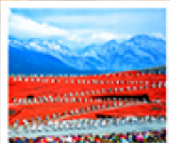
ไร่จางอวี่ทิมว