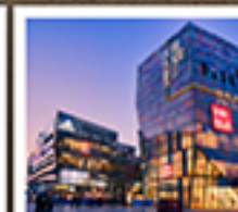
ย่านซานหลี่ตุ๋น