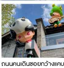
ถนนคนเดินชอยกว้างแคบ