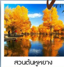
สวนต้นหูหยาง

พิธีเปิดเมืองเก่า / เมืองโบราณคัชการ์ / มัสยิดอิดคาห์ / ถนนคนเดินHandmade / โรงน้ำชาอู๋ยี่ / ทะเลสาบไ้ซาหุ / ทะเลสาบกาลาคู่เค่อ ภาษาหิมะ: Muztagh Peak / ทะเลทรายทากาลามากัน / จุดชมวิวทะเลแดง / แกรนด์แคนยอนเทียนชาน / สวนต้นหูหยาง / สวนหลงชาน / ตลาดต้าปาจา