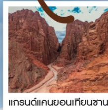
แกรนด์แคนยอนเทียนชาน