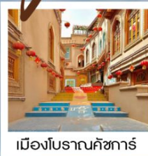
เมืองโบราณคัชการ์