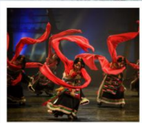
โชว์ทิเบต