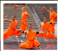
โชว์เส้าหลิน