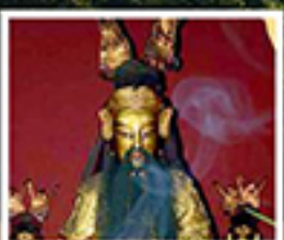
เอียงบู๊ซิว