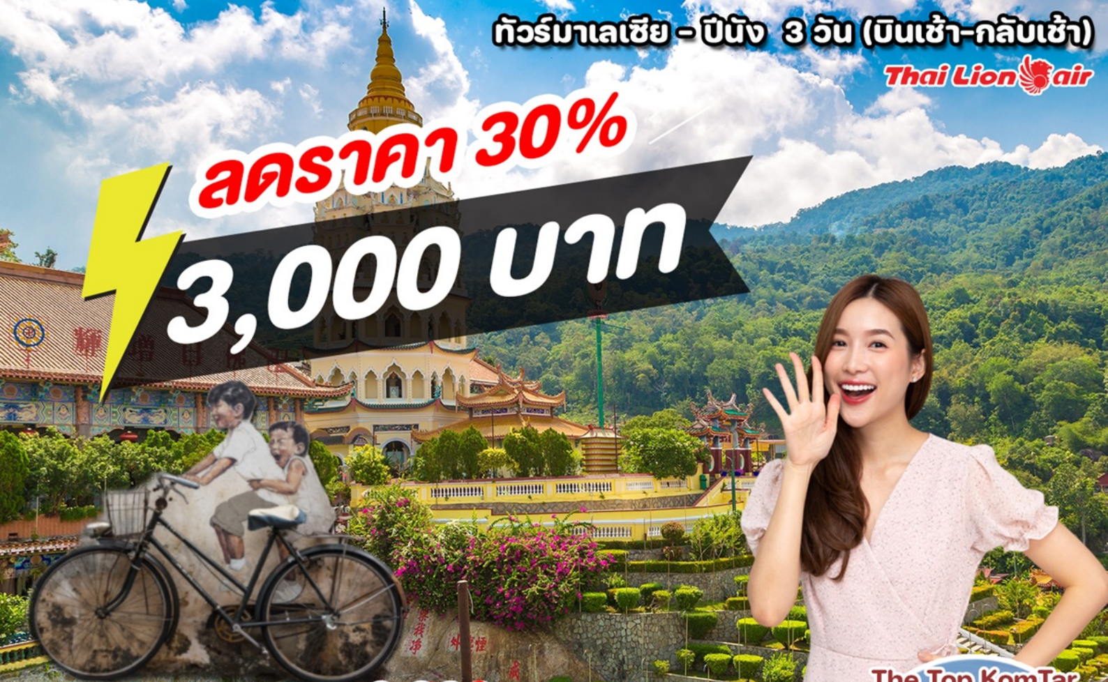
The Top KomTar