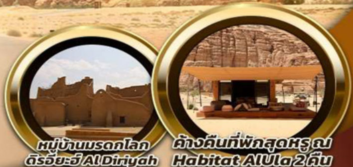
หมู่บ้านมรดกโลก ดิริยะฮ์ AlDiriyah