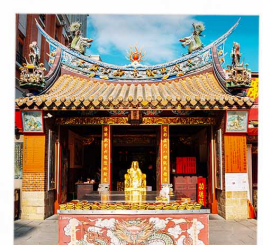
วัดเสี่ยวไท่เจิ้งหอง