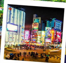
ช้อปปิ้งซีเหมินติง