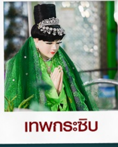
เทพกระซิบ