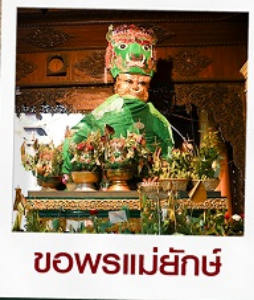
ขอพรแม่ย่า