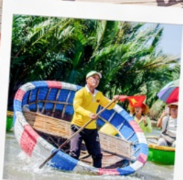
ล่องเรือกระต๊อง