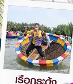
เรือกระด้ง