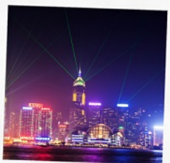
โชว์ SYMPHONY OF LIGHT