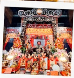
วัดเทพเจ้ากวนอู