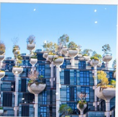
Tian An 1,000 Trees Square