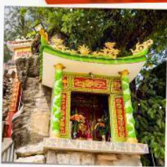
ศาลเจ้าติงซาอว