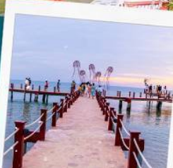
Sunset Sanato Beach Club