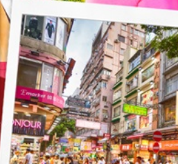
ช้อปปิ้งย่านมงก๊ก