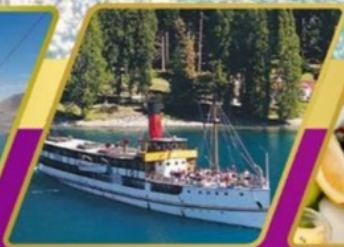
ล่องเรือกลไฟโบราณ อาหารแบบ BBQ ที่วอลเตอร์ฟิค ฟาร์ม