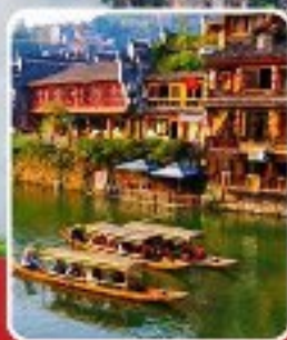
เมืองโบราณฟ่งหวง

เที่ยวฟิน 2 เมืองโบราณ พิชิตเขาวงกต แพนดอร่าของเมืองจีน