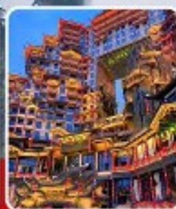
ตึก 72 ชั้น

อุทยานจางเจียเจีย เขาคิเยนจื่อซาน สะพานหนึ่งโบริดจ์ ทะเลสาบเป่าเฟิงหู ตึกมหิศจรรย์ 72 ชั้น เมืองโบราณฟูหลงเจิน เมืองโบราณฟ่งหวง ล่องเรือแม่น้ำถั่วเจียง สะพานสายรุ้ง ช้อปปิ้ง ถนนคนเดินหลงซิงลู่