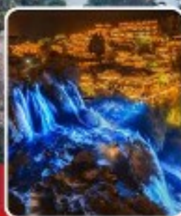
ฟูหลงเจิน