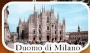
Duomo di Milano