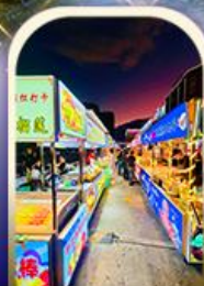
ตลาดอีหิง